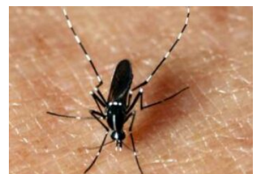
Un dangereux piqueur

Autre caractéristique à signaler : 29% patients atteints du syndrome de Guillain-Barré après une infection par le Zika ont nécessité une assistance respiratoire (forme grave) !