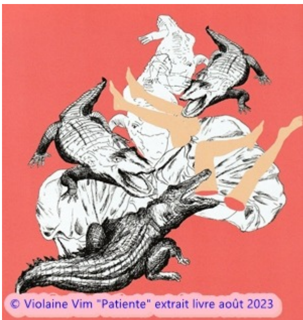
Impression de crocodiles dévorant les jambes

Durant l'évolution du syndrome de Guillain-Barré les muscles du corps deviennent faibles finissant par développer une paralysie flasque. L'absence de la couche de myéline gêne la transmission efficace des messages nerveux. Si les muscles respiratoires sont atteints une ventilation mécanique peut s'avérer nécessaire. Le système nerveux autonome, qui dirige les fonctions inconscientes et automatiques du corps, peut être atteint, provoquant des troubles cardiaques comme des battements cardiaques lents ou irréguliers et des changements