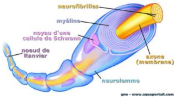
Schéma d'organisation d'un axone de nerf à myéline