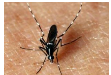
Un dangereux piqueur

Autre caractéristique à signaler : 29% patients atteints du syndrome de Guillain-Barré après une infection par le Zika ont nécessité une assistance respiratoire (forme grave) !