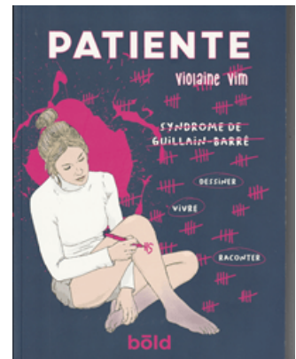
Couverture du livre de Violaine Vim

Si vous ne souhaitez pas acheter ces livres, demandez à la Maison pour tous, la Médiathèque ou la bibliothèque les plus proches de chez vous de les acheter. Vous pourrez les emprunter et les lire. Vous découvrirez que le Syndrome de Guillain-Barré peut s'inviter dans votre organisme (2.000 cas/an en France), à la suite d'une banale pathologie (grippe, mononucléose-maladie du baiser, hépatite, zona, oreillons, rougeole, rubéole, coqueluche, gastro-entérite, pneumonie, etc.) ou de certains vaccinations (à surveiller) ou récemment des maladies transmises par moustiques (dengue, zika, chikungunya). Ce sont des gâchettes dans le jargon de mon médecin neurologue (2019-2020). Ces gâchettes peuvent déclencher une des formes graves du syndrome de Guillain-Barré, celle où les douleurs sont insupportables ! Où plane le risque de la paralysie des muscles respiratoires et l'issue fatale, sauf diagnostics dans les délais les plus rapides et les soins appropriés. Dans la majorité des cas où ces soins ont tardé (Violaine Vim, 2023, snp), la guérison sera longue. Dans la forme axonale (Claude Pinault) la guérison est longue à venir. Pourtant, au long des derniers chapitres (3 et 4), les établissements de rééducation successifs arriveront à le remettre debout ! Il a vaincu ! Avec un mental d'acier, il a fait travailler en pensée les zones de son cerveau qui commandent ses membres [1] . Le miracle est arrivé : un jour un doigt tressaille ! Le « jus » recommence à circuler. Dans les