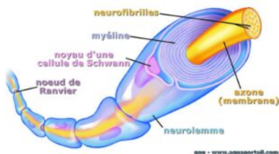
Schéma d'organisation d'un axone de nerf à myéline