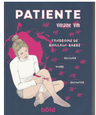
Couverture du livre de Violaine Vim

Si vous ne souhaitez pas acheter ces livres, demandez à la Maison pour tous, la Médiathèque ou la bibliothèque les plus proches de chez vous de les acheter. Vous pourrez les emprunter et les lire. Vous découvrirez que le Syndrome de Guillain-Barré peut s'inviter dans votre organisme (2.000 cas/an en France), à la suite d'une banale pathologie (grippe, mononucléose-maladie du baiser, hépatite, zona, oreillons, rougeole, rubéole, coqueluche, gastro-entérite, pneumonie, etc.) ou de certains vaccinations (à surveiller) ou récemment des maladies transmises par moustiques (dengue, zika, chikungunya). Ce sont des gâchettes dans le jargon de mon médecin neurologue (2019-2020). Ces gâchettes peuvent déclencher une des formes graves du syndrome de Guillain-Barré, celle où les douleurs sont insupportables ! Où plane le risque de la paralysie des muscles respiratoires et l'issue fatale, sauf diagnostics dans les délais les plus rapides et les soins appropriés. Dans la majorité des cas où ces soins ont tardé (Violaine Vim, 2023, snp), la guérison sera longue. Dans la forme axonale (Claude Pinault) la guérison est longue à venir. Pourtant, au long des derniers chapitres (3 et 4), les établissements de rééducation successifs arriveront à le remettre debout ! Il a vaincu ! Avec un mental d'acier, il a fait travailler en pensée les zones de son cerveau qui commandent ses membres [1] . Le miracle est arrivé : un jour un doigt tressaille ! Le « jus » recommence à circuler. Dans les